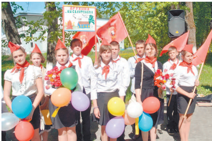
Пионерская дружина имени И.И. Селифопова.